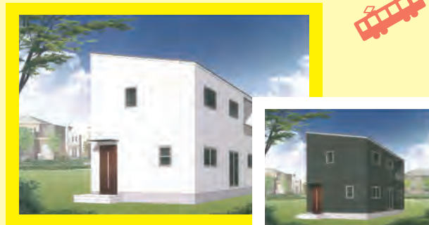
※イメージバースです。