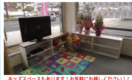
キッズスペースもあります!お気軽にお越しください!!

三重県知事許可 一級建築士事務所1-1570号 三重県知事許可 建設(般22)第015153号