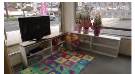
キッズスペースもあります!お気軽にお越しください!!

三重県知事許可 一級建築士事務所1-1570号 三重県知事許可 建設業(般22)第015153号