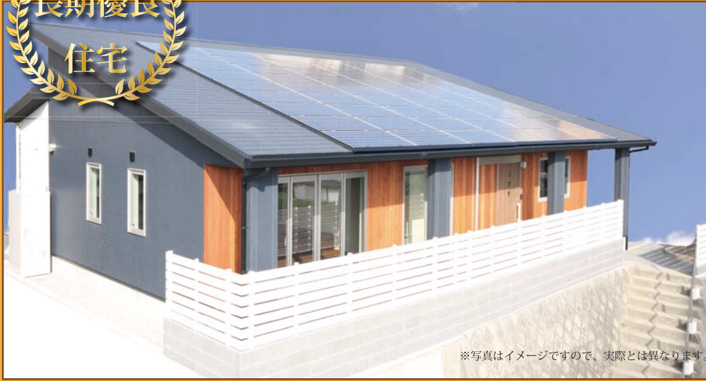
※写真はイメージですので、実際とは異なります。